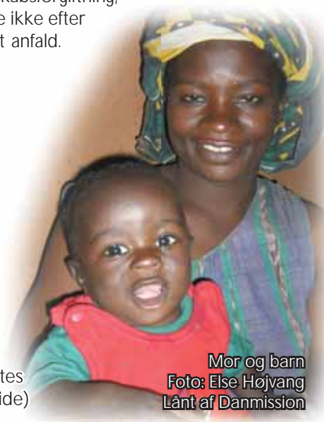
Mor og barn